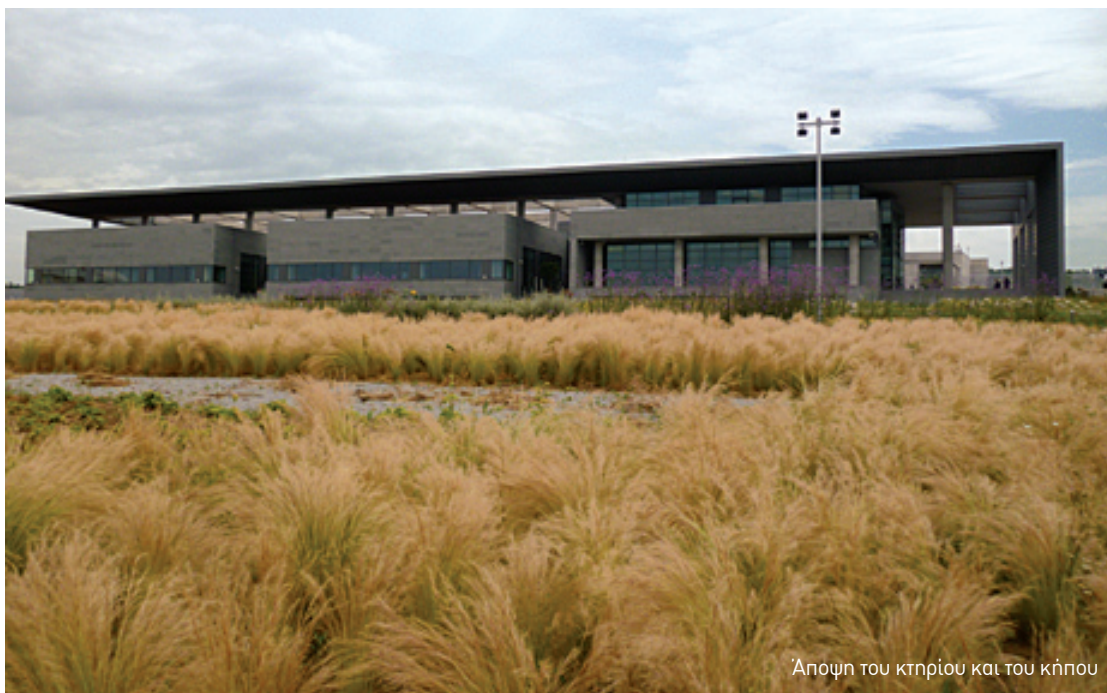
Άποψη του κτηρίου και του κήπου

Η κεντρική ιδέα της διαμόρφωσης του κήπου προσεγγίζει εκείνη της ακαλλιέργητης από χρόνια γης. Ένας τέτοιος τόπος εμπεριέχει την απρόβλεπτη, δυναμική εξελικτική της φύσης στην πιο ανόθευτη της μορφή, όταν γεννιέται, ζει, φθίρει και πάλι αναδημιουργείται, ως οικοσύστημα αυτόνομο, ως αυτάρκης ζωντανός οργανισμός, με μικρή μόνο συνδρομή του ανθρώπου. Είναι ικανός και ελεύθερος να αφομοιώσει, να προσαρμοστεί, να μεταμορφωθεί, εγγράφο-