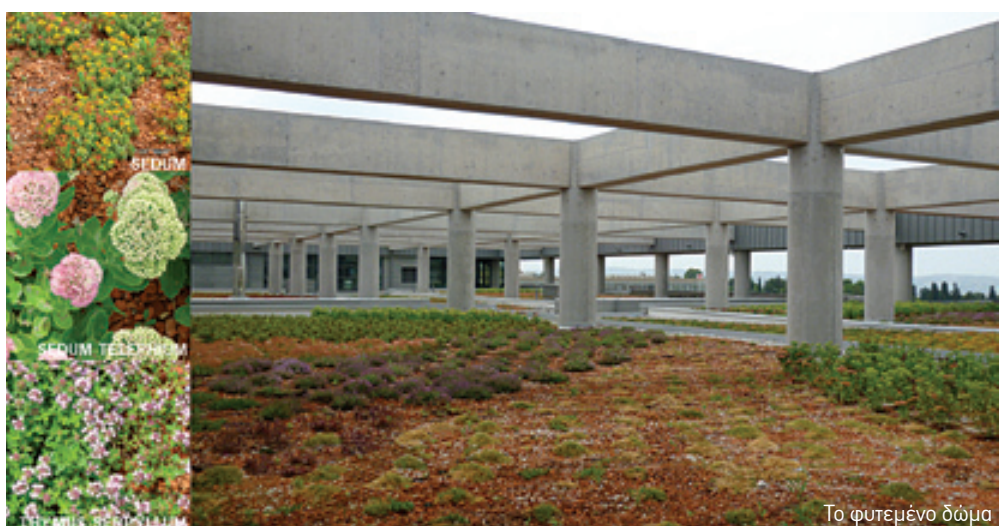
Το φυτεμένο δώμα