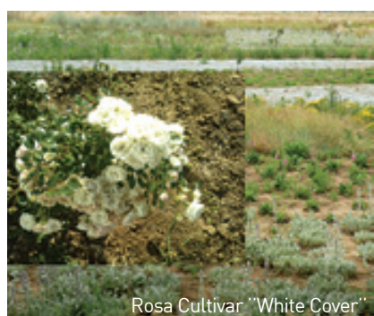
Rosa Cultivar "White Cover"