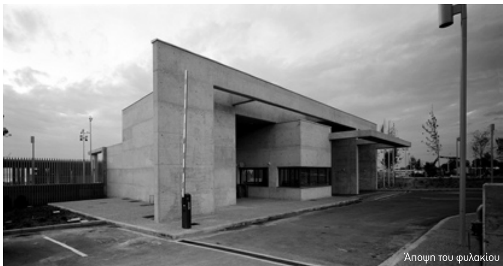
Άποψη του φυλακίου