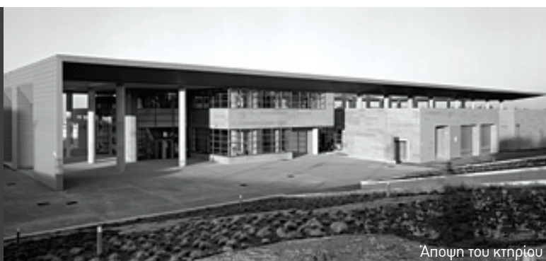
Άποψη του κτηρίου