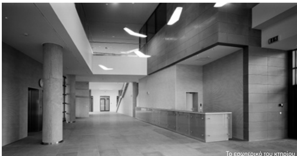
Το εσωτερικό του κτηρίου